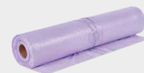
3M™ Purple Premium PLUS Przejroczysta folia maskująca 4 m x 150 m, 5 m x 120 m, 6 m x 120 m

► Przykryj pojazd tak szybko, jak to możliwe, dzięki czemu ograniczasz ryzyko zanieczyszczenia powierzchni zanieczyszczeniami ze środowiska.