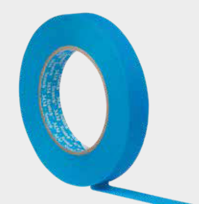
3M™ Scotch® Taśma maskująca 3434

6 Dokładne maskowanie przed lakierowaniem – mocowanie części