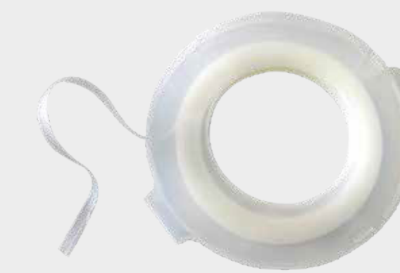
3M™ Gładka taśma do odcięć lakieru

Uwaga: Nie należy dopuszczać do powstawania ostrych krawędzi podczas nakładania taśmy maskującej przed nałożeniem podkładu. To powoduje tworzenie się pęcherzyków na powierzchni w wyniku gromadzenia się rozpuszczalników na krawędziach taśmy.