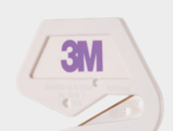
3M™ Nożyk Premium