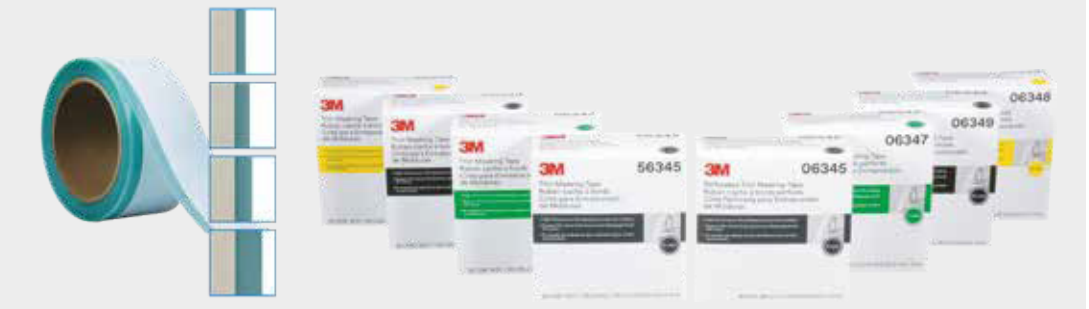
3M™ Trim Taśma maskująca

4 Przykrycie z grubszą przed nałożeniem podkładu