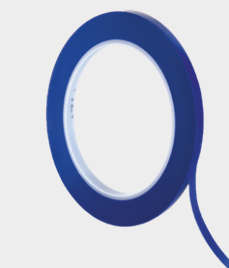
3M™ Fine Line Taśmy maskujące 471+

► Zamaskuj inne obszary, takie jak elementy gumowe, wykończeniowe itp.