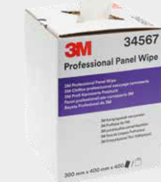
3M™ Profesjonalne ściereczki do paneli

► Usuń tłuszcz z powierzchni przy użyciu produktu oferowanego przez producenta lakieru lub innego zalecanego produktu. Zawsze postępuj zgodnie z instrukcjami producenta.