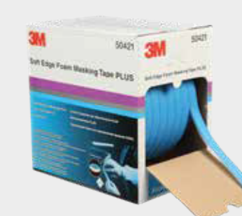
3M™ Soft Edge Plus Piankowa taśma maskująca

► Wytnij folię maskującą do odpowiedniego rozmiaru i przymocuj do maskowania konturu za pomocą taśm maskujących 3M.